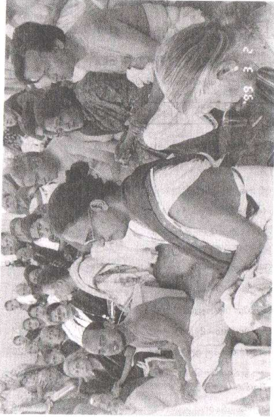
ஸோம்நாத் கோமதி நதி ஸங்கமத்தில் ஸ்வாமிகளும், பக்தர்களும் ஸங்கல்பம் செய்யும் காட்சி.